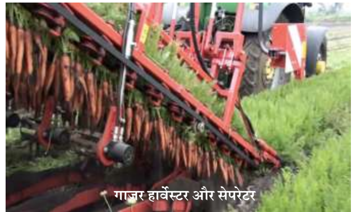
गाजर हार्वेस्टर और सेपरेटर