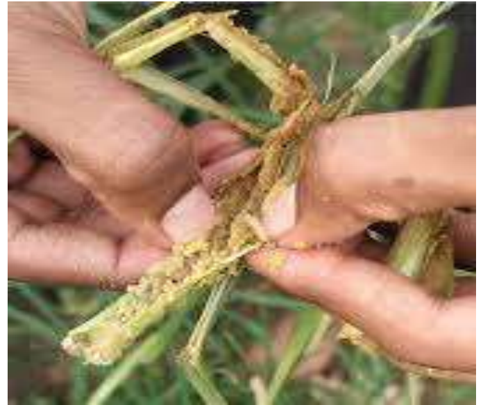
रागी का तना छेदक कीट (Stem Borer)