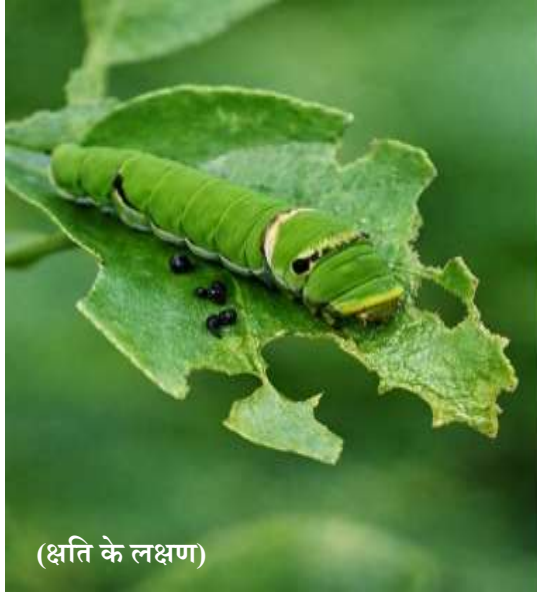
(क्षति के लक्षण)

IPM एक ऐसी वैज्ञानिक पद्धति है जिसमें कीट नियंत्रण के लिए सस्य क्रियाओं, जैविक, यांत्रिक