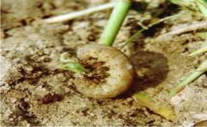
रागी का सैनिक एवं कुतरा सुंडी (Cutworm / Armyworm)