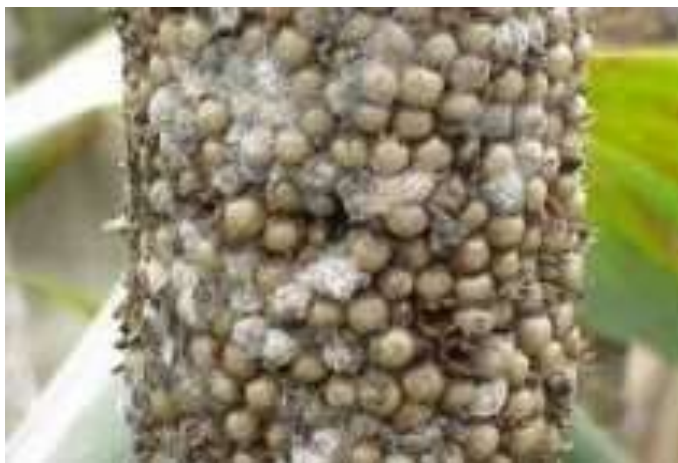
रागी का भुरड़ रोग