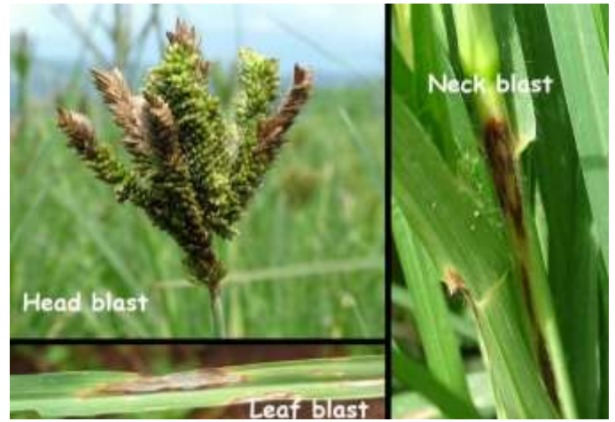
रागी का भुरड़ रोग / नेक ब्लास्ट (Neck Blast)