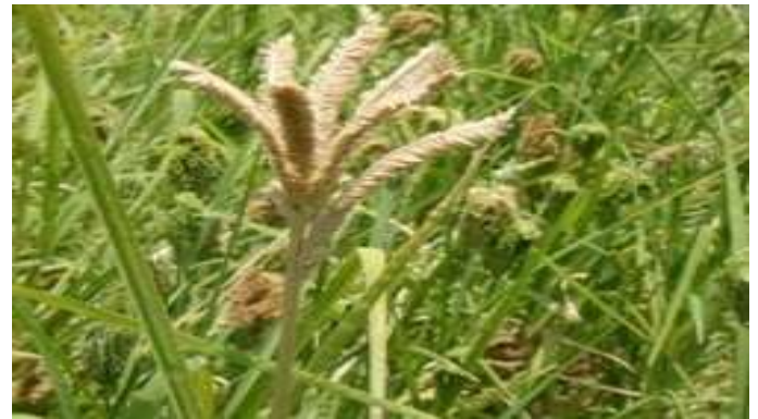
रागी का तने का सफेद केंचुआ