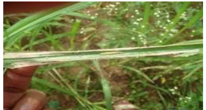
रागी का पत्ता लपेट सुंडी