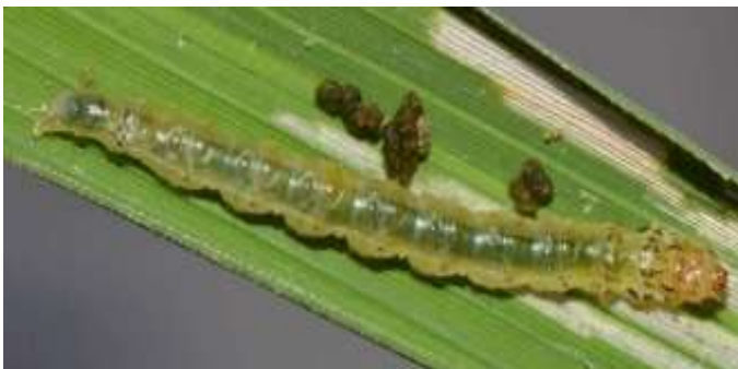
रागी का घास के टिड्डे