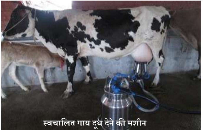
स्वचालित गाय दूध देने की मशीन