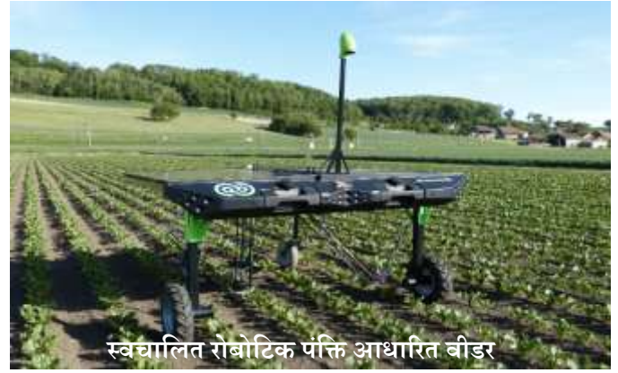
स्वचालित रोबोटिक पंक्ति आधारित वीडर

जैसा कि सभी जानते हैं, अच्छी फसल बनाए रखने के लिए निराई करना एक अनिवार्य हिस्सा है। अपने खेतों में फसल को उगाने में खरपतवार और आक्रामक प्रजातियां फसल को खराब करती हैं और