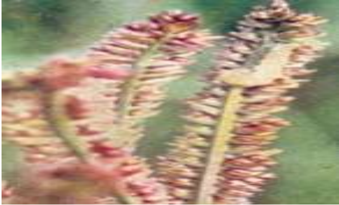
रागी के बालियों का टिड्डा