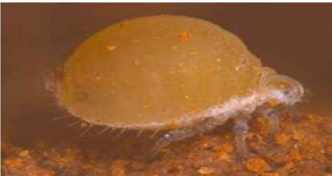
रागी का चेपा (Aphid)