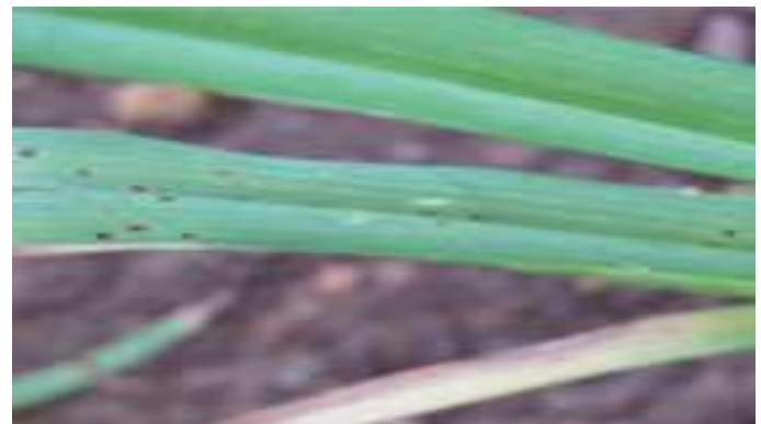
रागी का पत्ती झुलसा (Leaf Blight)