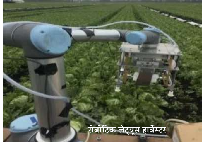
रोबोटिक लेट्यूस हार्वेस्टर

लेट्यूस फसल एक बहुत ही जटिल पत्तेदार हरा पौधा है, और इसके लिए अक्सर सैकड़ों श्रमिकों को दिन भर झुकने और खड़े होने की आवश्यकता होती है। इस दोहराव की गतिविधि से श्रमिक को ज्यादा समस्या होती है। अतः किसानों के लिए कुछ करने की आवश्यकता पड़ी। लेट्यूस हार्वेस्टिंग उद्योग में एक क्रांति की तरह रोबोटिक लेट्यूस हार्वेस्टर उभर कर सामने आता है और फसल लेने में स्वचालन वास्तव में बेहतर रोजगार पैदा कर रहा है।