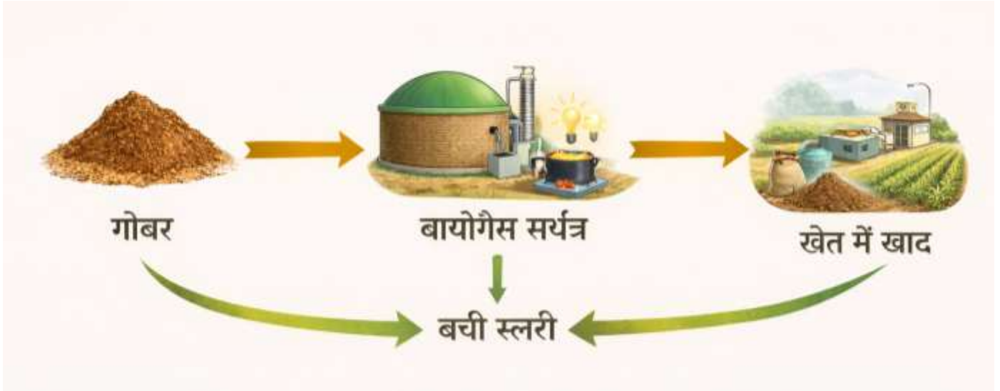
एकीकृत कृषि प्रणाली में बायोगैस आधारित चक्रीय मॉडल का प्रवाह-चित्र