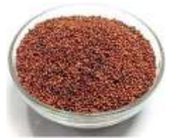
रागी का बीज

रागी एक उष्णकटिबंधीय एवं उपोष्णकटिबंधीय जलवायु की फसल है, जिसे समुद्र तल से लगभग 2100 मीटर ऊँचाई तक उगाया जा सकता है। यह गर्म जलवायु पसंद करने वाली फसल है। इसके बीजों के अंकुरण के लिए 8-10 डिग्री सेल्सियस तापमान आवश्यक होता है, जबकि पौधों की अच्छी वृद्धि एवं विकास के लिए 26-29 डिग्री सेल्सियस तापमान उपयुक्त माना जाता है। रागी की खेती 500-900 मिमी वार्षिक वर्षा वाले क्षेत्रों में सफलतापूर्वक की जाती है। मध्यम वर्षा एवं संतुलित नमी इसकी अच्छी उपज के लिए लाभकारी होती है।